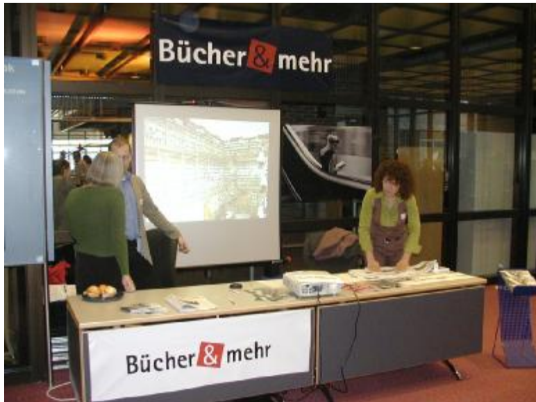
Bücher & mehr am Tag der offenen Tür im November 2005 im Gasteig

In Skandinavien und Wien startete die ersten Projekte mit Erfolg. Jetzt realisiert München das